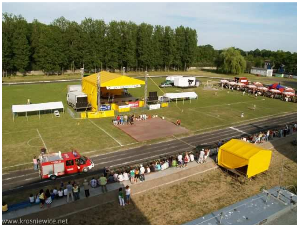
Fot. Impreza „Dni Krośniewic” odbywa się każdego roku na obiekcie stadionu miejskiego

Stadion Miejski zajmuje powierzchnię 2,43 ha. Mieści się na nim obecnie płyta boiska do piłki nożnej, trybuny na 400 osób, budynek Ośrodka Kultury z pomieszczeniami dla klubu sportowego (magazyn sprzętu, dwie szatnie plus sanitariaty), pomieszczenie kasy przy bramie wjazdowej oraz budynek gospodarczy. Z uwagi na stan infrastruktury w 2007r. Gmina Krośniewice zleciła wykonanie dokumentacji projektowej na jego rozbudowę. W związku z powyższym obiekt stadionu jest obecnie w stanie przebudowy. W roku 2008 dokonana została jest wycinka drzew oraz melioracja płyty boiska. Na rok 2009 w budżecie Gminy Krośniewice planowane jest niweleta i zasianie trawy na płycie boiska do piłki nożnej oraz wykonanie boiska wielofunkcyjnego. Z uwagi na możliwości finansowe Gminy oraz możliwości wykonania przedsięwzięcia o bardzo szerokim kompleksowym zakresie: min. nowej bieżni o nawierzchni ceglanej, zadaszenia trybun, torów, pochylni rowerowych i licznych pozostałych elementów – zadanie to zostało podzielone na etapy.