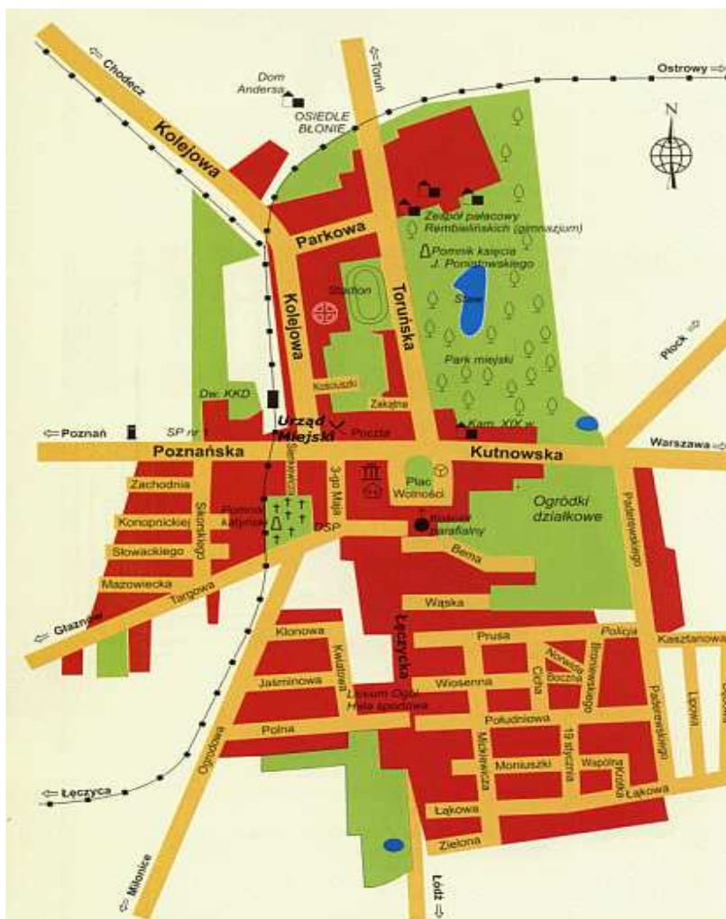
Plan miasta Krośnice