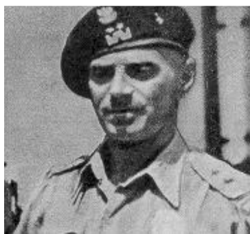
Fot. Generał Władysław Anders