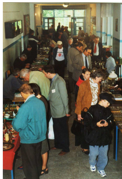
Fot. Ogólnopolskie Święto Kolekcjonerów

Ogólnopolskie Święto Kolekcjonerów Impreza ta jest najpoważniejszym przedsięwzięciem merytoryczno-organizacyjnym programu „Przeszłość – Przyszłości”. Od 2002 r. jest corocznie organizowana w pierwszą sobotę i niedzielę czerwca w budynkach muzeum i na terenie Krośniewic. W pierwszym dniu święta ma miejsce uroczystość wręczenia Honorowej Nagrody Hetmana Kolekcjonerów Polskich Jerzego Dunin-Borkowskiego, otwierana jest wystawa z cyklu „Współcześni kolekcjonerzy polscy”, odbywa się Aukcja antykwaryczna „Kolekcjonerzy Swojemu Hetmanowi”. Dochód z aukcji jest przeznaczany na organizowanie przy muzeum - Centrum Kolekcjonerstwa Polskiego, imprezę kończy spotkanie kolekcjonerskie. W tej części imprezy uczestniczą władze polskiego ruchu kolekcjonerskiego i innych ogólnopolskich stowarzyszeń specjalistycznych, przedstawiciele klubów kolekcjonerskich, laureaci Honorowej Nagrody i goście honorowi. W drugim dniu święta, na placu przed muzeum, organizowane są Targi kolekcjonerskie „Na skrzyżowaniu”, z udziałem kolekcjonerów-wystawców z terenu całej Polski oraz inne imprezy towarzyszące.